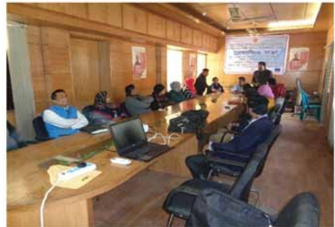
Quarterly meeting with municipality health officials

Data Collector Orientation: EHNSM Project has been launched by April, 2018 to the selected municipalities of Bangladesh. 106 data collectors hired for 6 municipalities for selecting beneficiaries for the project. One day orientation was held consecutively from 15/07/2018 to 22/07/2018. Concerned mayor of the municipalities was present there. Training coordinator conducted the programme under guidance Mr. Dinobondhu Dutta, Central Coordinator.