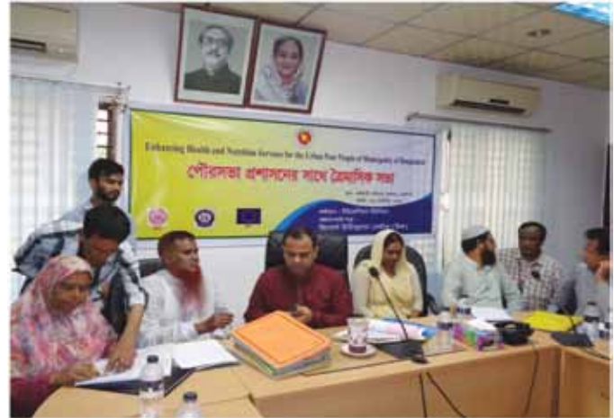
Quarterly meeting with municipality administration

Quarterly meeting with municipality administration and health officers: These meeting was held consecutively in six municipalities of the project area.