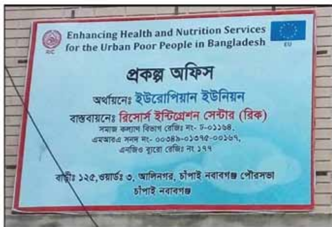
Project Office Signboard

Office Setup: Offices has been setting up to the concerned municipality for ensuring the healthcare of the poor that is funded by EU and implementing by RIC.