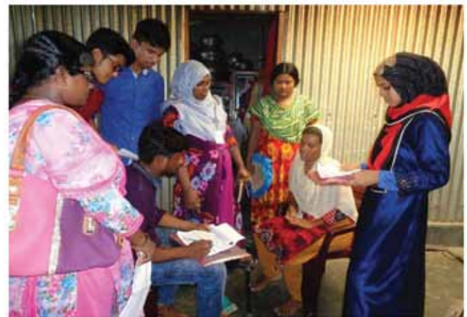
Data collectors are busy for data collection